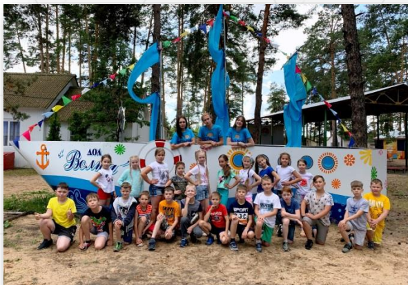
График смен муниципальных лагерей